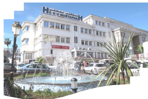
المركز الإستشفائي الجامعي مصطفى